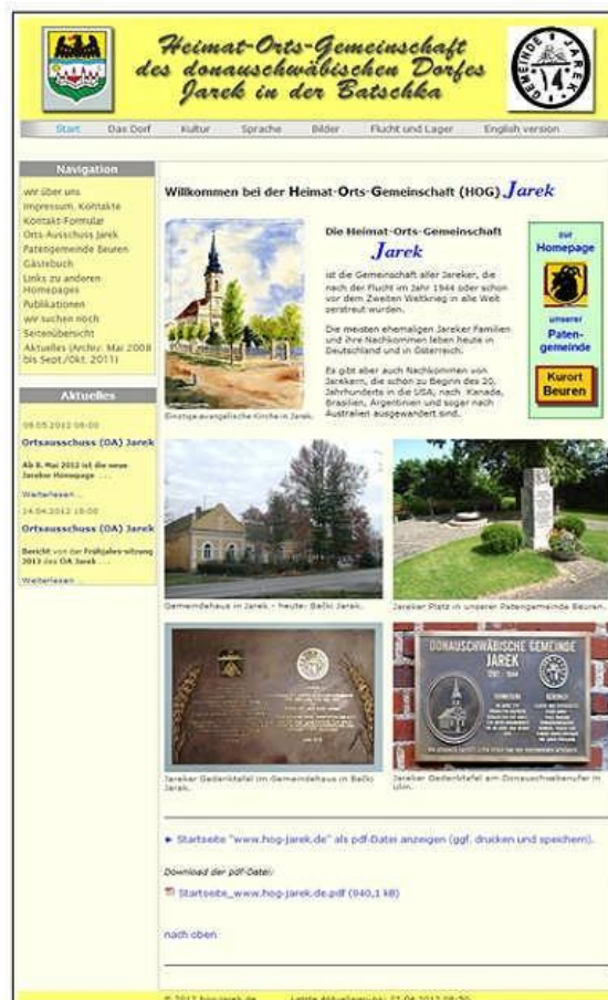
The English version of the new homepage Jarek.

Mit der Auswahl der Haupt-Seite "English version" ganz rechts wird die "Start-Seite" in Englischer Sprache angezeigt: