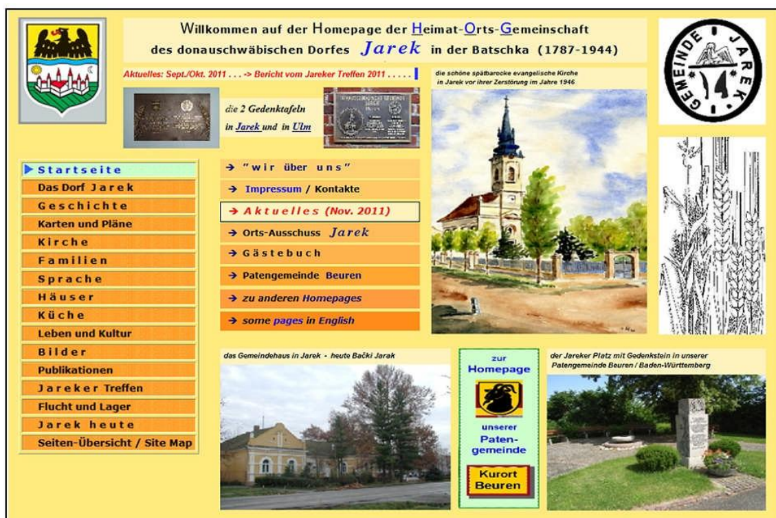
Die bisherige Jareker Homepage (bis April/Mai 2012).

Gegenüber der bisherigen Jareker Homepage mit der Startseite . . . . .